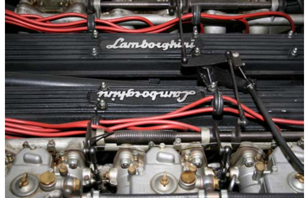
12-Zylinder-Vergasermotor im 400 GT

Aber auch die weniger bekannten Fahrzeuge, wie einen Urraco oder 400 GT, sind Bestandteil der in Deutschland wahrscheinlich einmaligen Sammlung, die besichtigt werden kann.