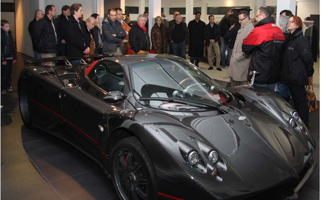
Gleich zur Begrüßung in der Eingangshalle: Supersportwagen Pagani Zonda F in Sicht-Carbon-Lackierung