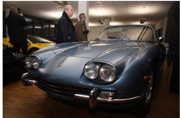
Lamborghini 400 GT

Die Besichtigung der Lamborghin-Sammlung startete mit einem Miura in Originalzustand, mit dem die Fa. Lamborghini 1966 endgültig bewies, dass sie nicht nur Traktoren bauen konnte, sondern dem Nachbarn Enzo Ferrari in Maranello zur ernst zu nehmenden Konkurrenz wurde.